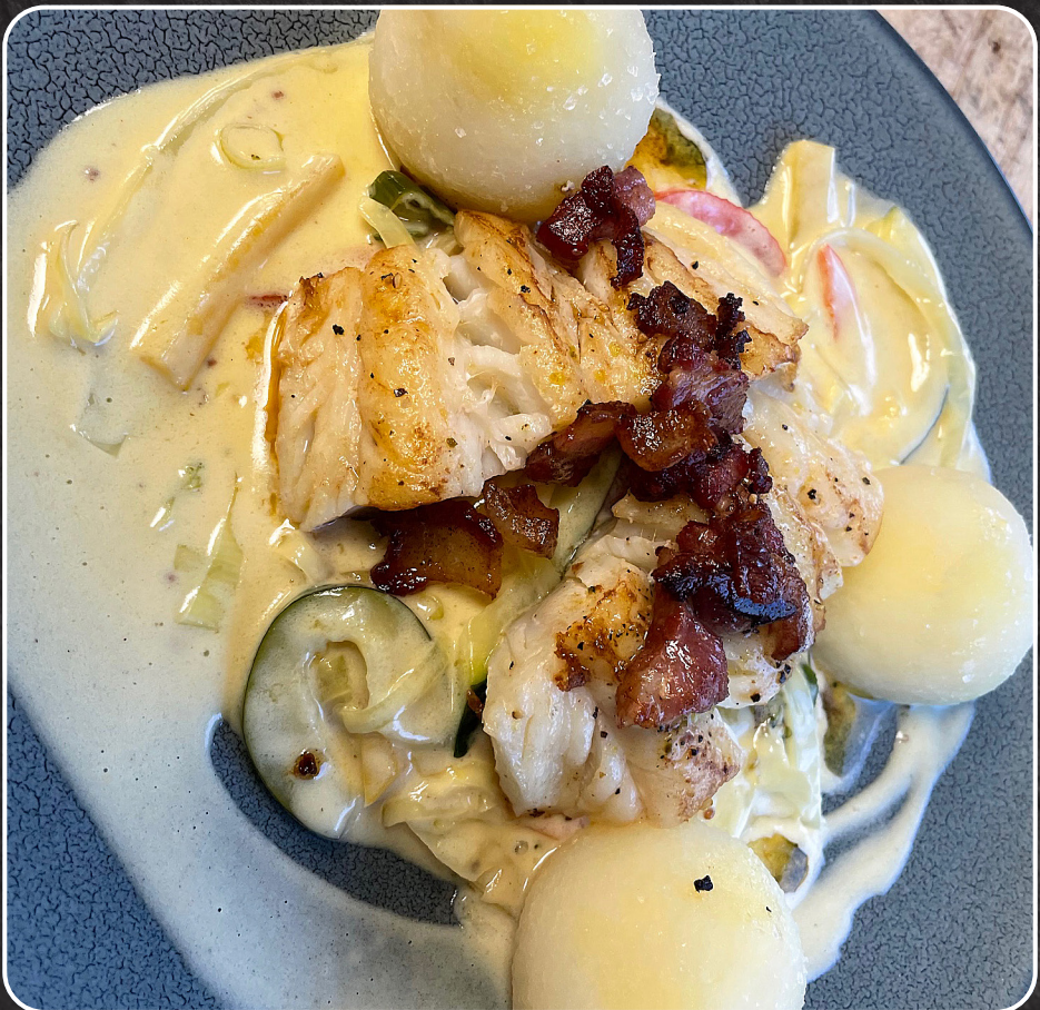
62. Grillet tørrfisk