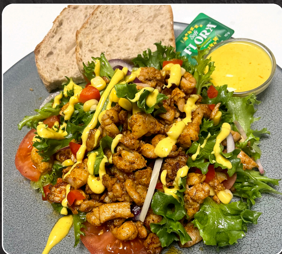
43. Lun kyllingsalat