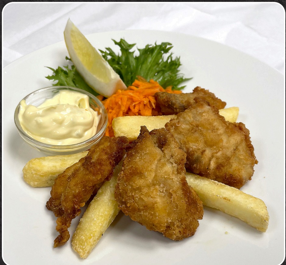
53. Corners berømte forrett - Sprøstekte torsketunger