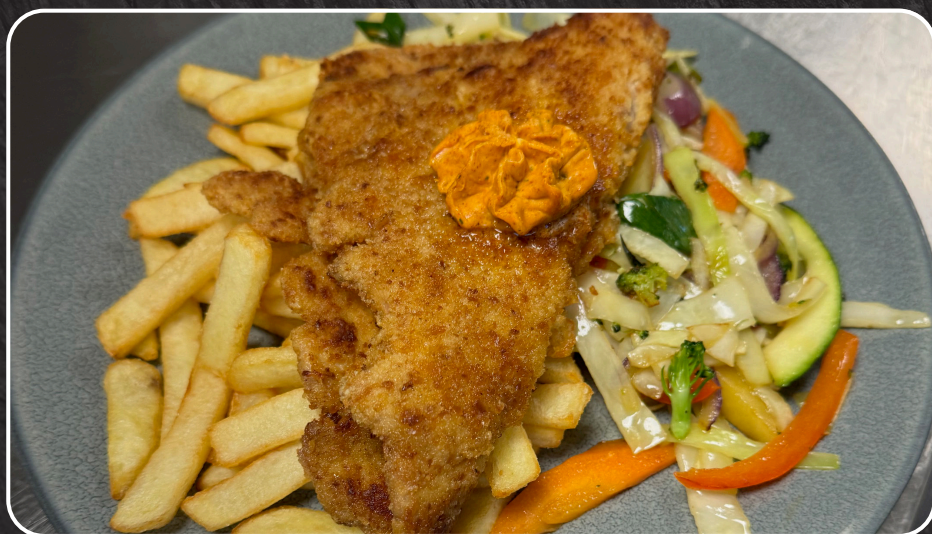
73. Corners hjemmelagde schnitzel

Remulade 28,- Inneholder: Egg, melk, sennep