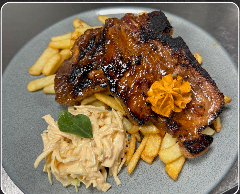
74. Marinerte nakkekoteletter

Tillegg for fløtepotet til våre retter, +kr 30,-